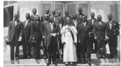
Document 6 : le premier gouvernement de l'abbé Fulbert Youlou.