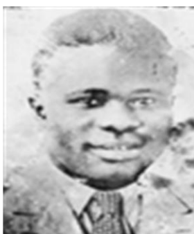
Jean Félix TCHICAYA (PPC)

Document 3 : les trois (3) leaders politiques congolais au Moyen-Congo.