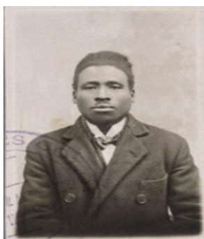
Document 1 : André Grenard Matsoua

C'est un mouvement politique issu de l'association « Amicale des originaires de l'AEF », créé le 17 juillet 1926 à Paris par André Grenard Matsoua dans le but de protester contre les abus du pouvoir colonial (code de l'indigénat, travail forcé...). Mais, l'administration coloniale riposte par les arrestations. Ainsi, Matsoua est arrêté le 03 avril 1940 à Paris et rapatrié à Mayama (Moyen-Congo) où il meurt en janvier 1942 en prison.