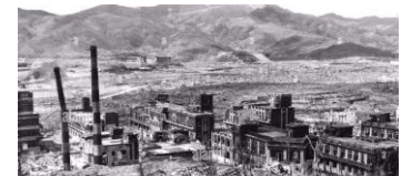
La ville de Nagasaki