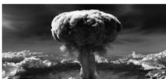
La bombe atomique au Japon