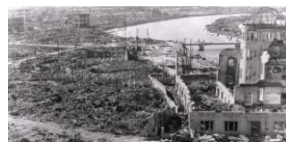
La ville d'Hiroshima