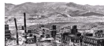
La ville de Nagasaki