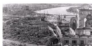
La ville d'Hiroshima