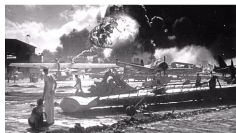
Attaque japonaise contre Pearl Harbor

Le 7 décembre 1941, le Japon qui veut s'assurer la maîtrise du pacifique détruit, par surprise et sans déclaration de guerre, la flotte américaine basée à Pearl-Harbor dans les îles Hawaï. Le lendemain, les Etats-Unis entrent en guerre contre le Japon. La guerre devient alors mondiale.